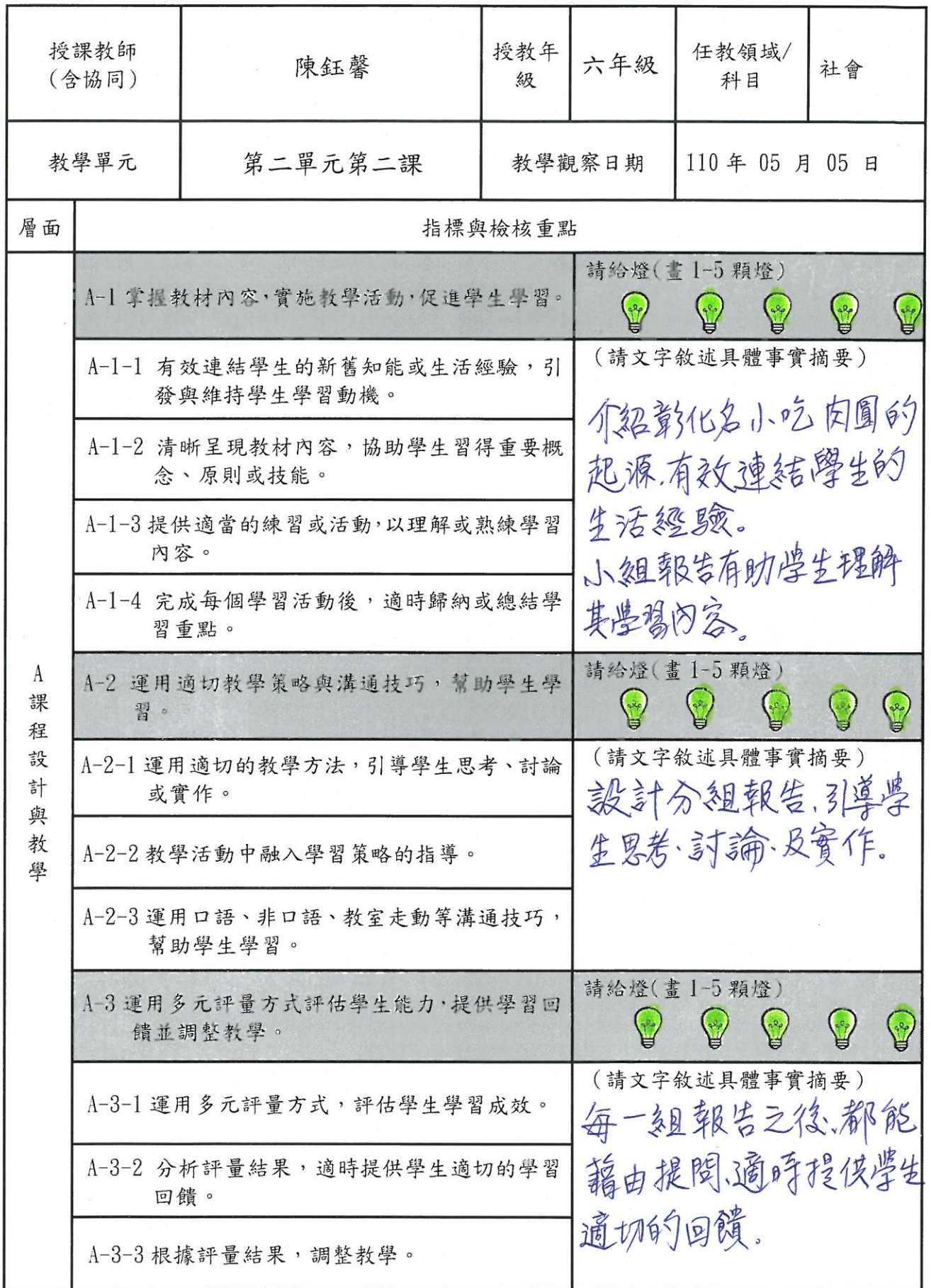
表 2、觀課紀錄表(會後請交回工作人員)