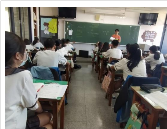
學生課堂上認真聽課