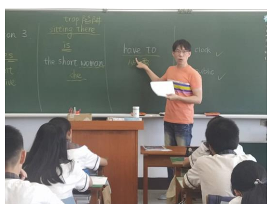
教師回答同學問題