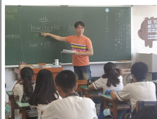
教師詢問同學問題