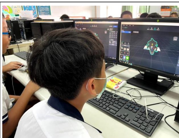
編輯 makar 專案