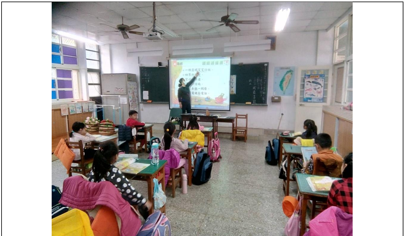
照片說明:教師進行課文認讀教學