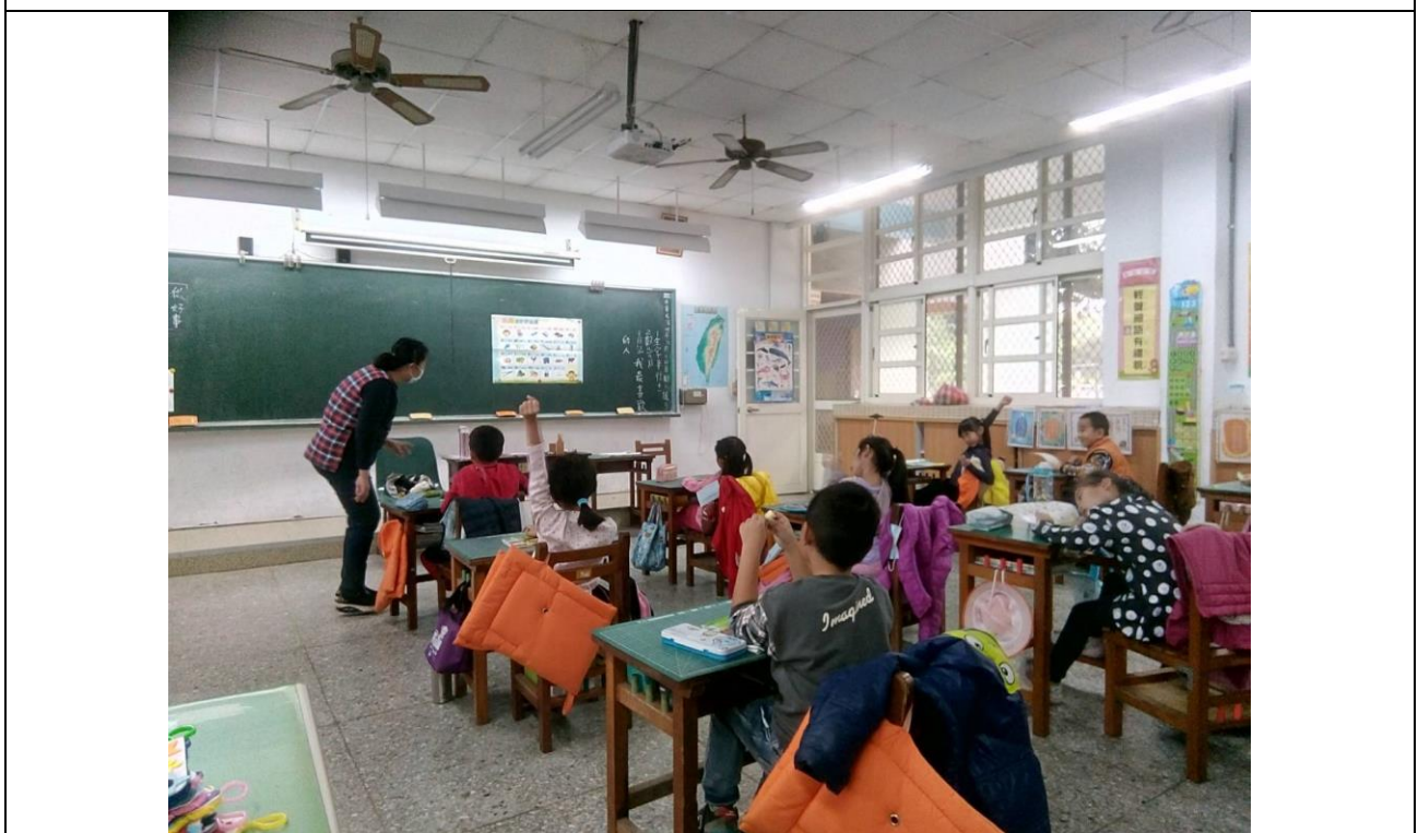
照片說明:教師帶領學生複習語詞