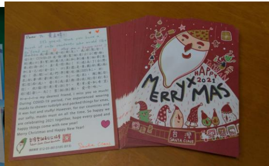
台灣聖誕老公公協會的回信