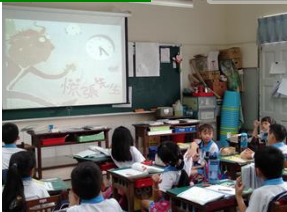
守時繪本故事—慌張先生