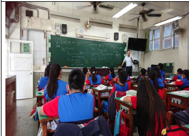
本單元三個句型教學