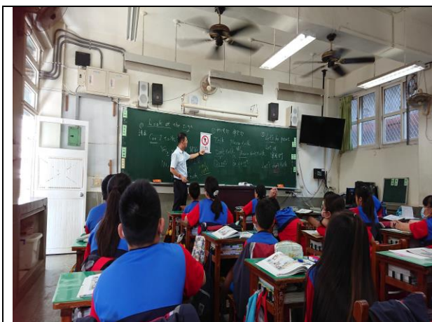
實體圖卡融入祈使句應用