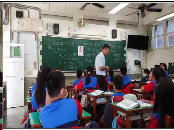
走到台下隨機找同學來練習句型口語練習