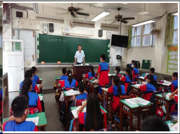
暖身活動：抽同學問看過的校園標誌