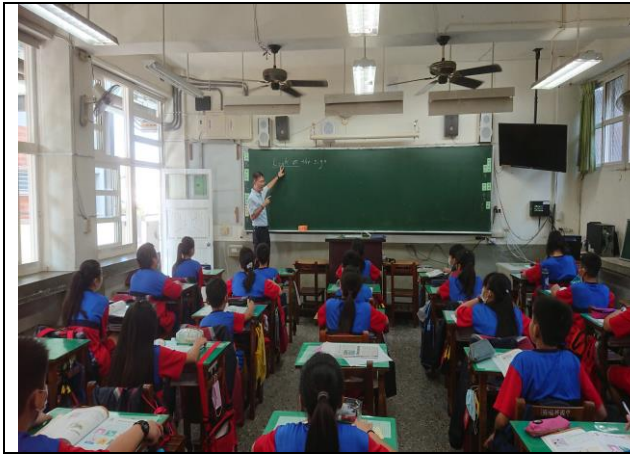
解釋大標題，全班全神貫注看著校園大人物