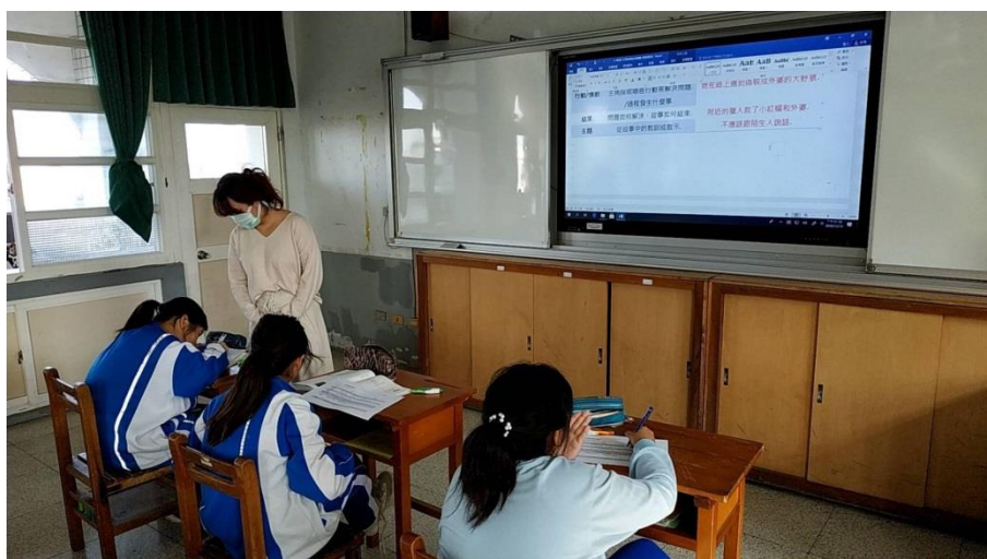
觀課活動紀錄照片2-概念解說完後，與學生進行口頭討論，並寫下答案。