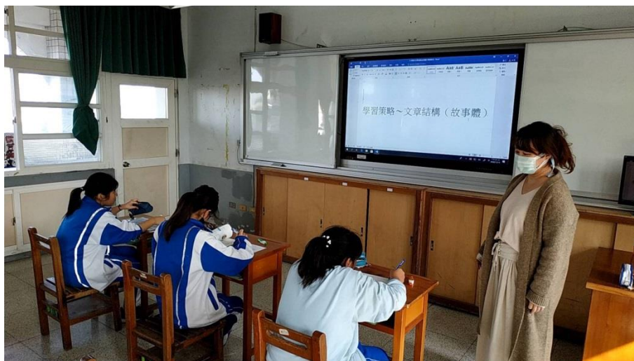
觀課活動紀錄照片1-使用智慧教室螢幕教學。