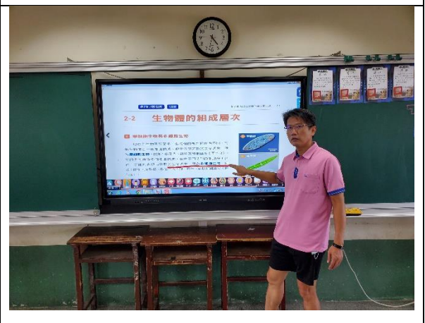
說明；利用大電視講解課程內容