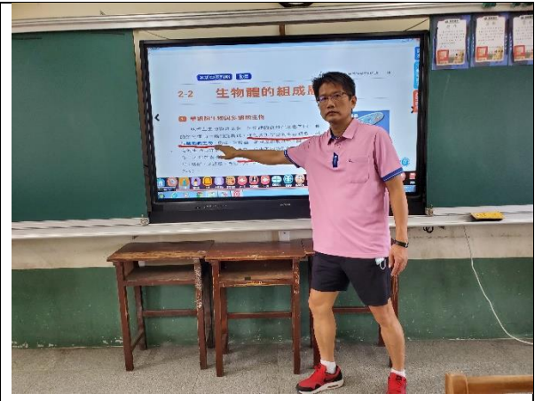
說明；利用大電視講解課程內容