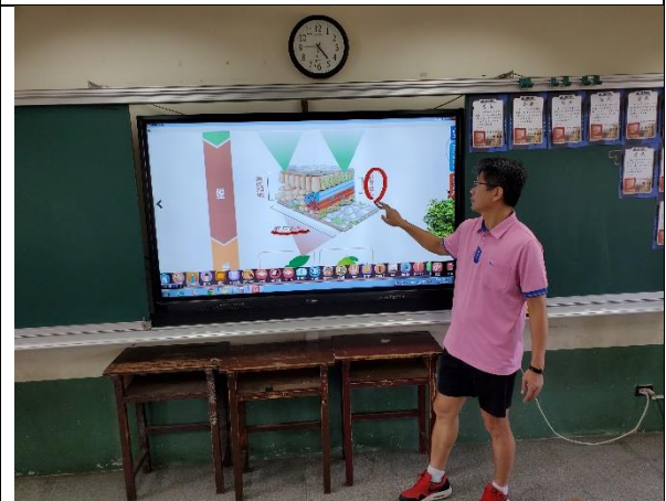
說明；利用大電視講解課程內容