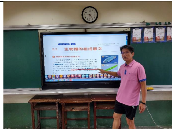
說明；利用大電視講解課程內容