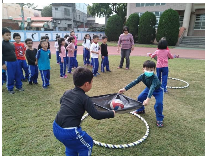
說明： 學生討論後再進行拋球練習。