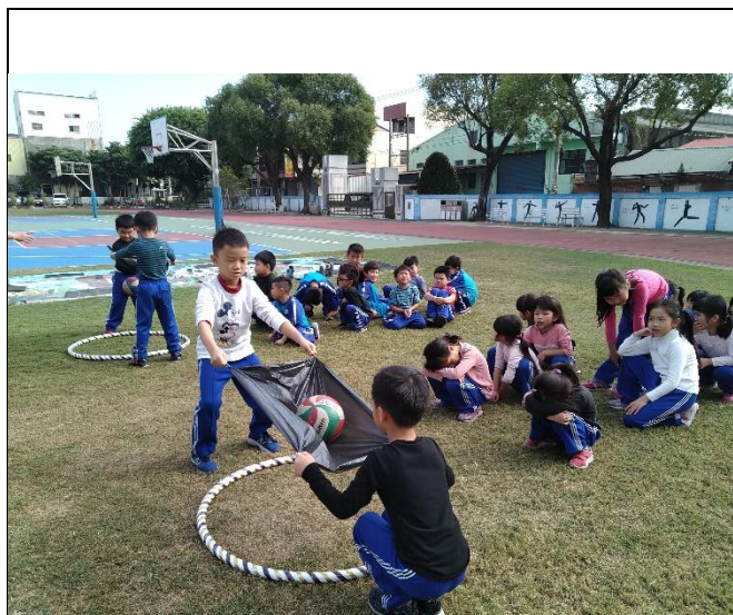
說明： 學生第一次練習拋球。