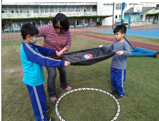
說明： 學生示範「時間一致、高度相同」的動作