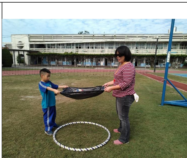
說明： 師生討論拋球技巧