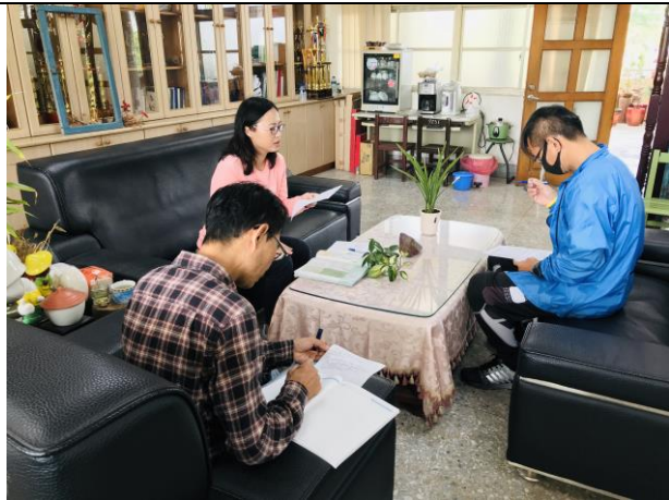
共同備課-授課前會談

觀察日期：110 年 3 月 24 日(四) 地點：七年 1 班教室(行政大樓 3 樓)