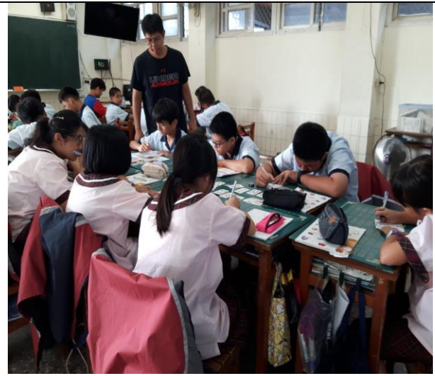
學生書寫學習單時，老師在一旁指導。學生如果有不懂，老師可以立即指導。