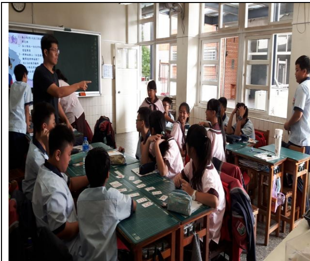
第一次結束後，老師詢問學生會贏的策略是什麼，並與同學分享。