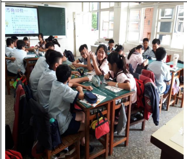
進行小組討論時，學生都很開心的將自己的感受表達出來。