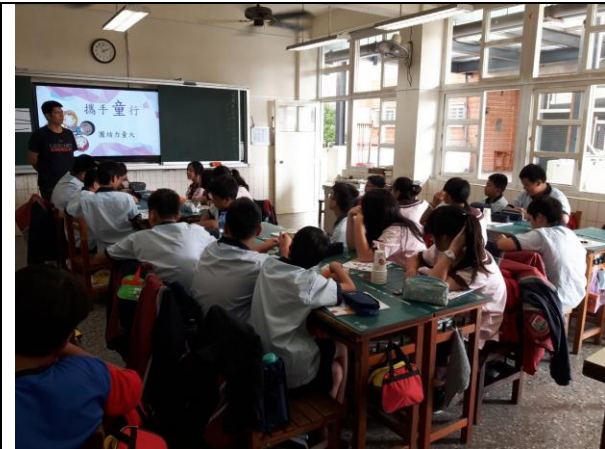
老師請學生說出自己曾與人合作的經驗，這合作的經驗是成功或是失敗。