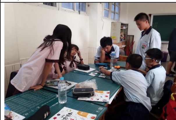
小隊快完成體驗活動，很興奮的站起來等待最後一張牌被找到。