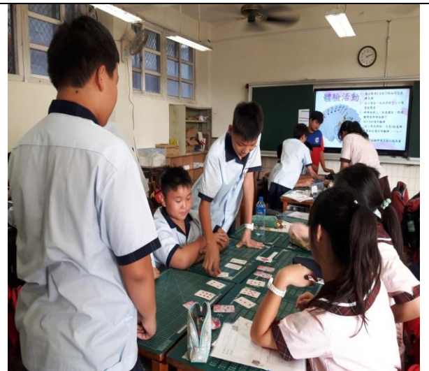
第二次玩時，學生也已掌握原則，很快的便完成體驗活動了。