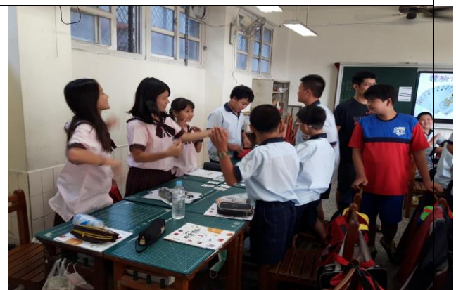
完成任務後，小隊以小隊呼告知眾人完成。