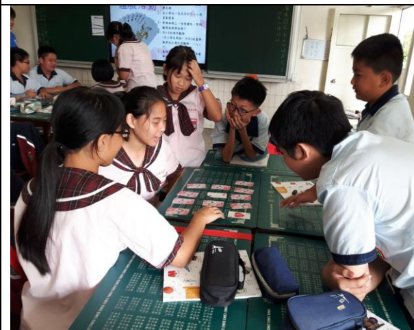
學生思考待會體驗活動進行時，應採取什麼策略。