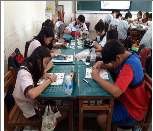
學生正認真的書解學習單的問題。