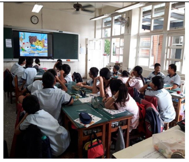
學生觀賞動畫，利用做蛋糕的到例子讓學生了解到團不團結的重要性。