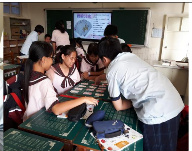
有一領導者出來告訴同隊的同学作戰策略。