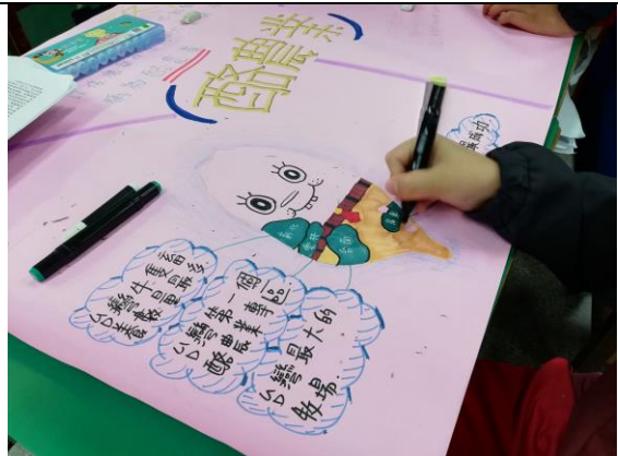
說明：心智圖繪製與討論