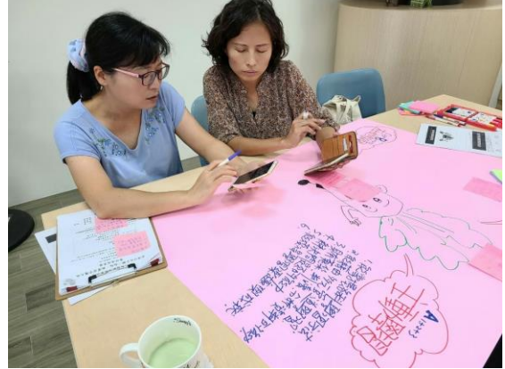
說明：校本核心小組共備會議