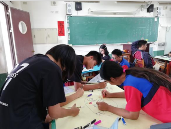
說明：心智圖繪製與討論