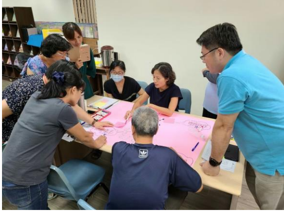
說明：校本核心小組共備會議