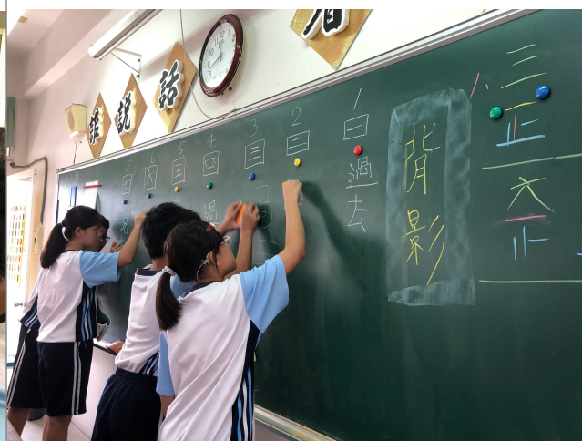
黃色上台寫答案（第一堂）