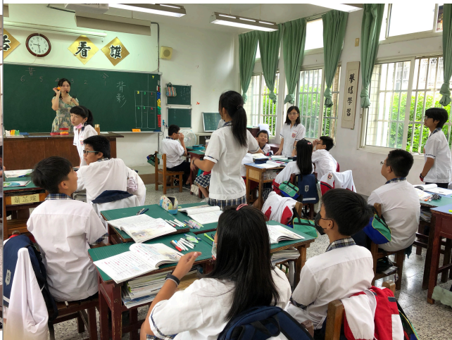
各組綠色搶答時間