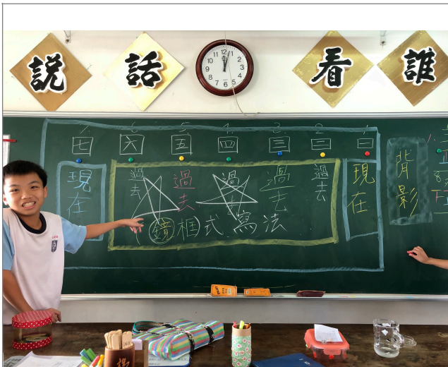
鏡框式寫法（第一堂）