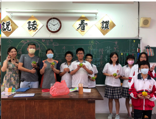
觀課夥伴教師合影