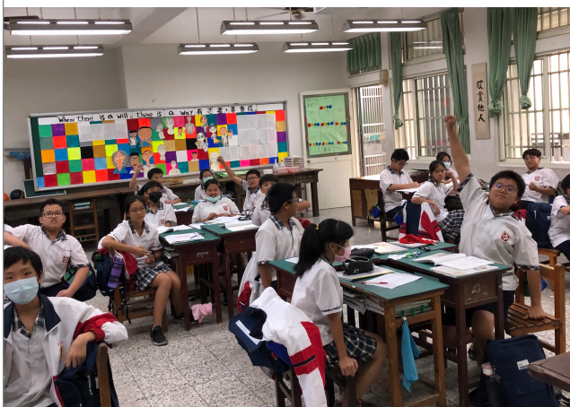
各組藍色搶答時間