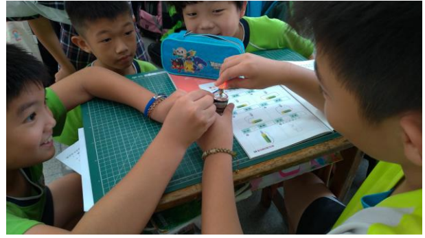
小組根據電路圖實際操作