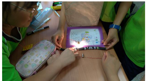
串聯電池 並聯燈泡