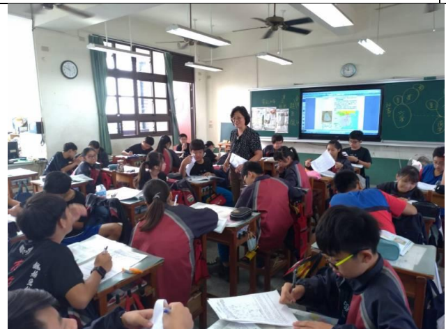
老師走下講台，與學生互動