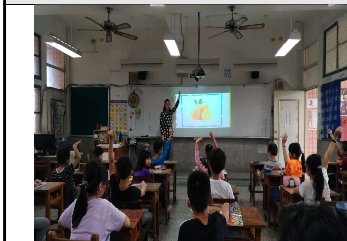
以多媒體複習單字