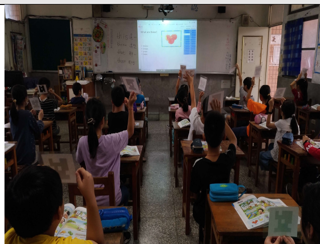
利用科技 app 立即檢測學生對單字辨識情況