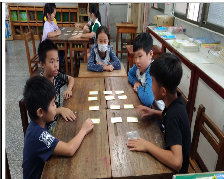
指導小組利用單字卡練習單字