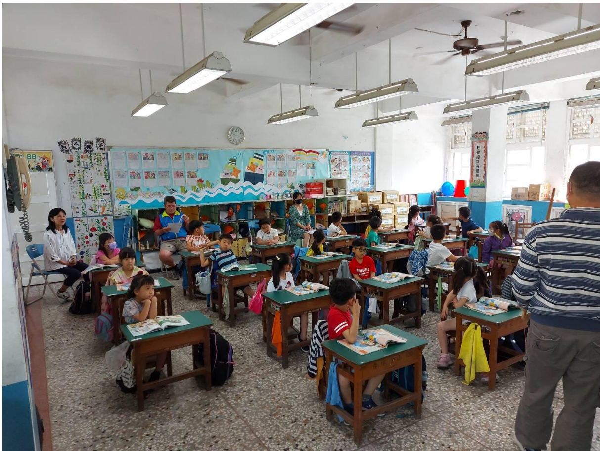
參與觀課的教師與家長4人(1位在拍照)