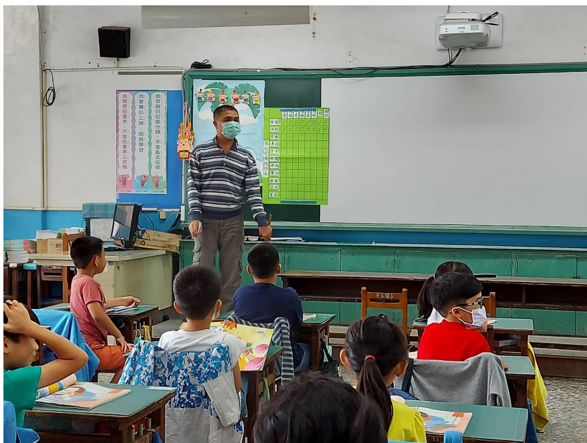
女生自己說出家庭成員之人數(發展活動)