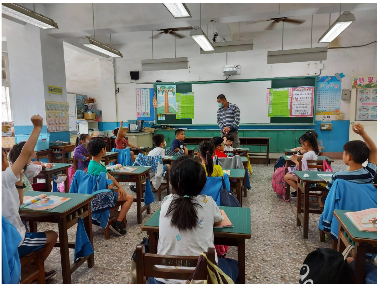
教師針對整理出來的所有資料進行說明與分析(總結活動)