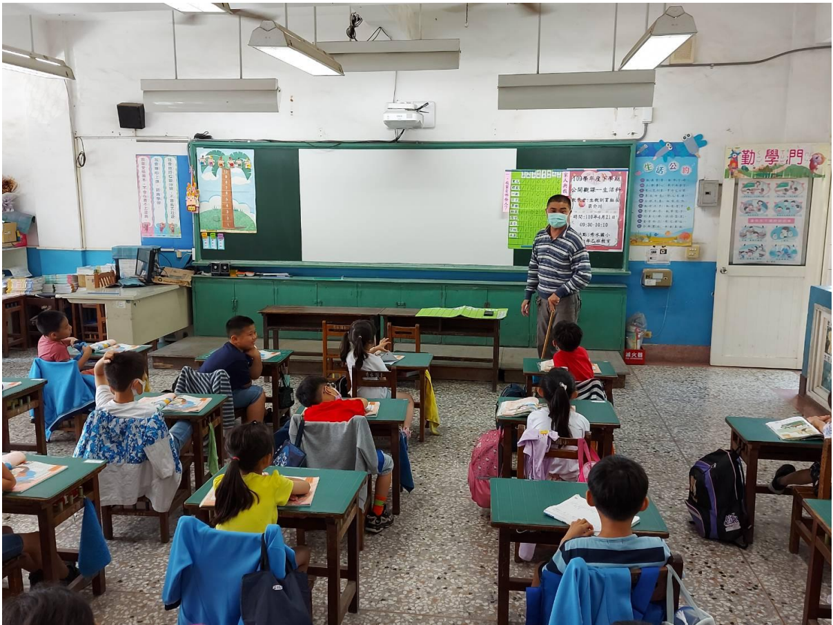
教師針對男生整理出來的資料進行說明與分析(總結活動)