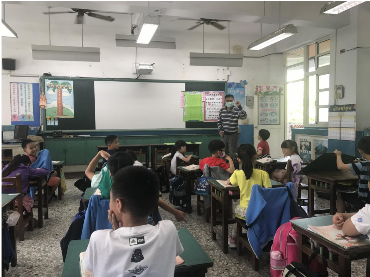
教師舉實例說明家庭成員的遊戲規則(引起動機)