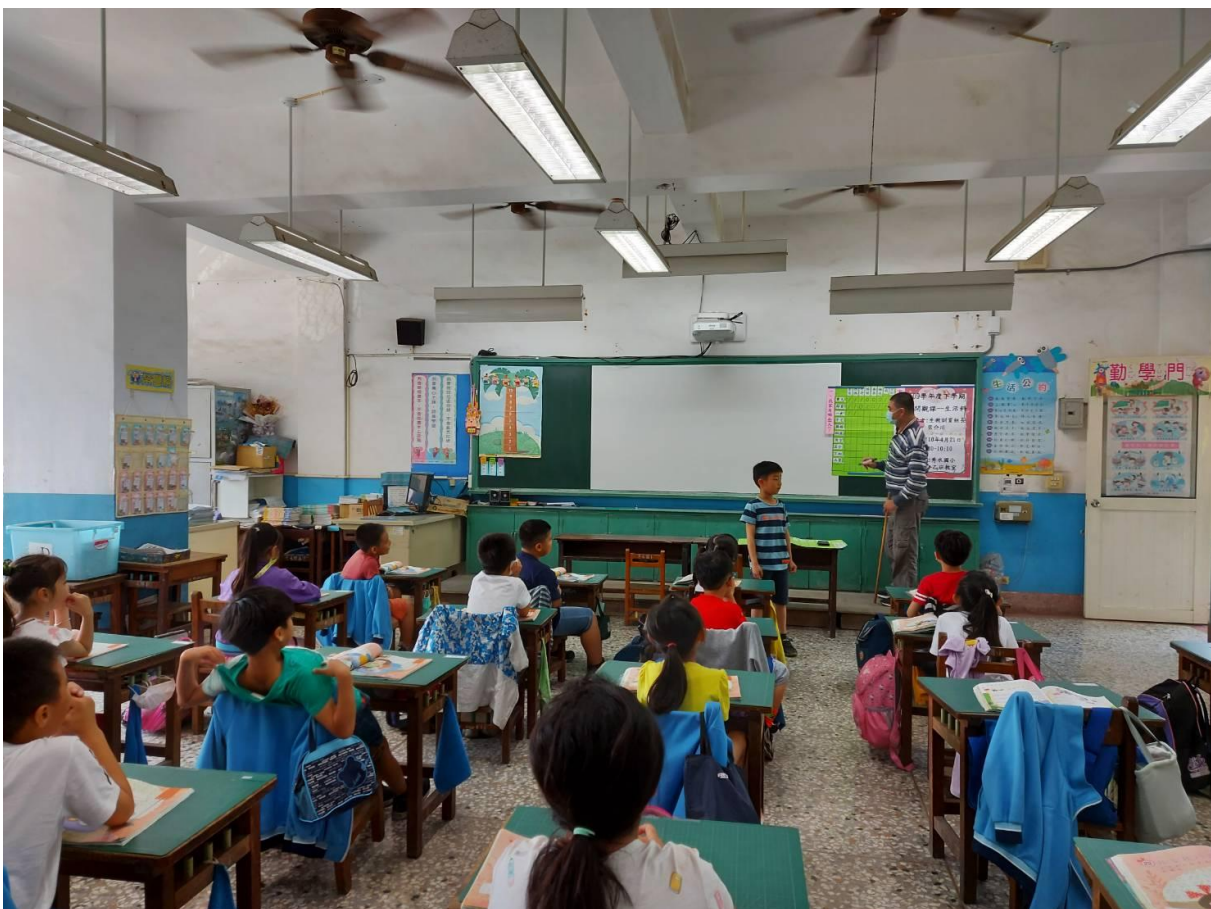
男生自己說出家庭成員之人數(發展活動)