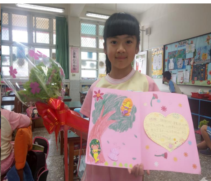
學生展示與分享所設計的卡片