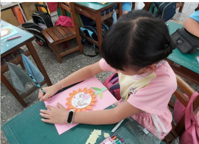
學生動手設計卡片封面