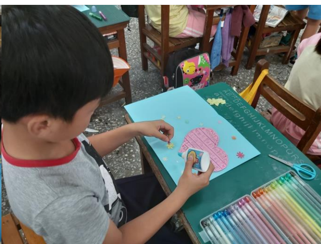
學生動手設計卡片內頁