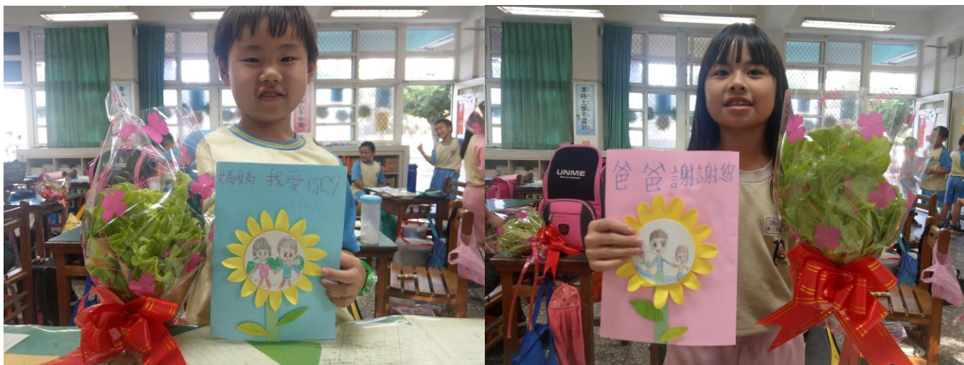
學生展示與分享所設計的卡片