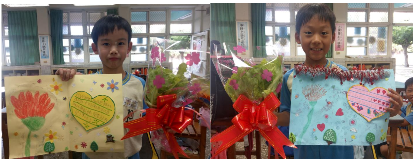
學生展示與分享所設計的卡片