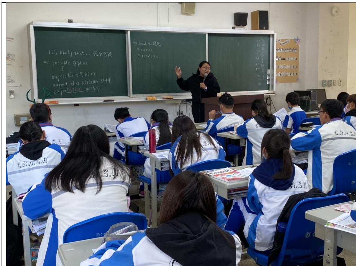
照片1說明：講解課文中結構較為複雜的句子