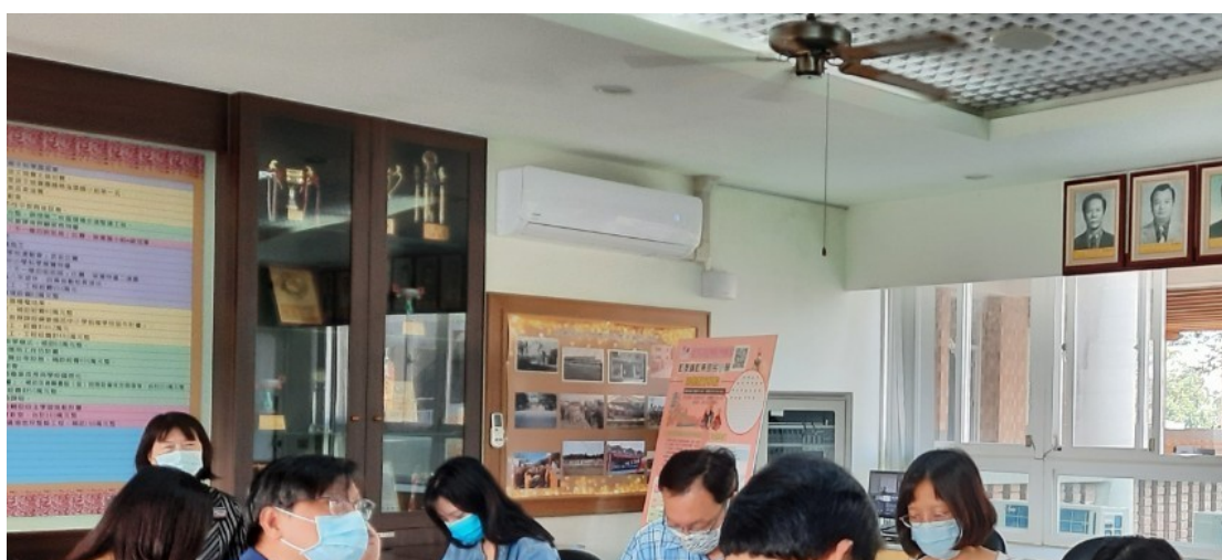
觀課教師提問，授課教師予以解答回應