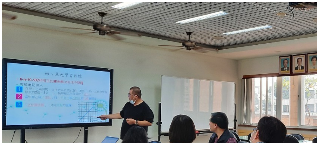
授課教師針對今日課程進行說課