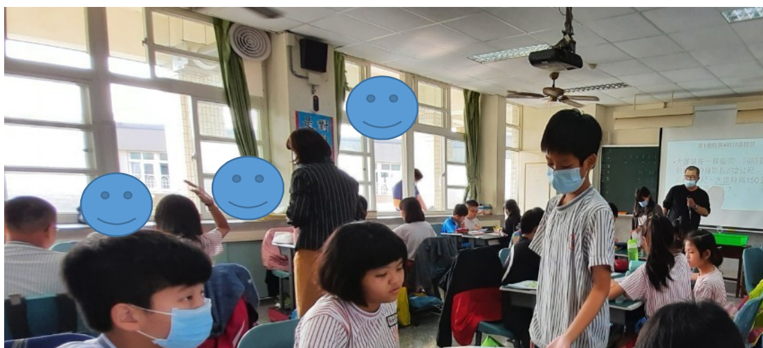
學生進行組內共學，觀課教師進行個別觀察學生學習