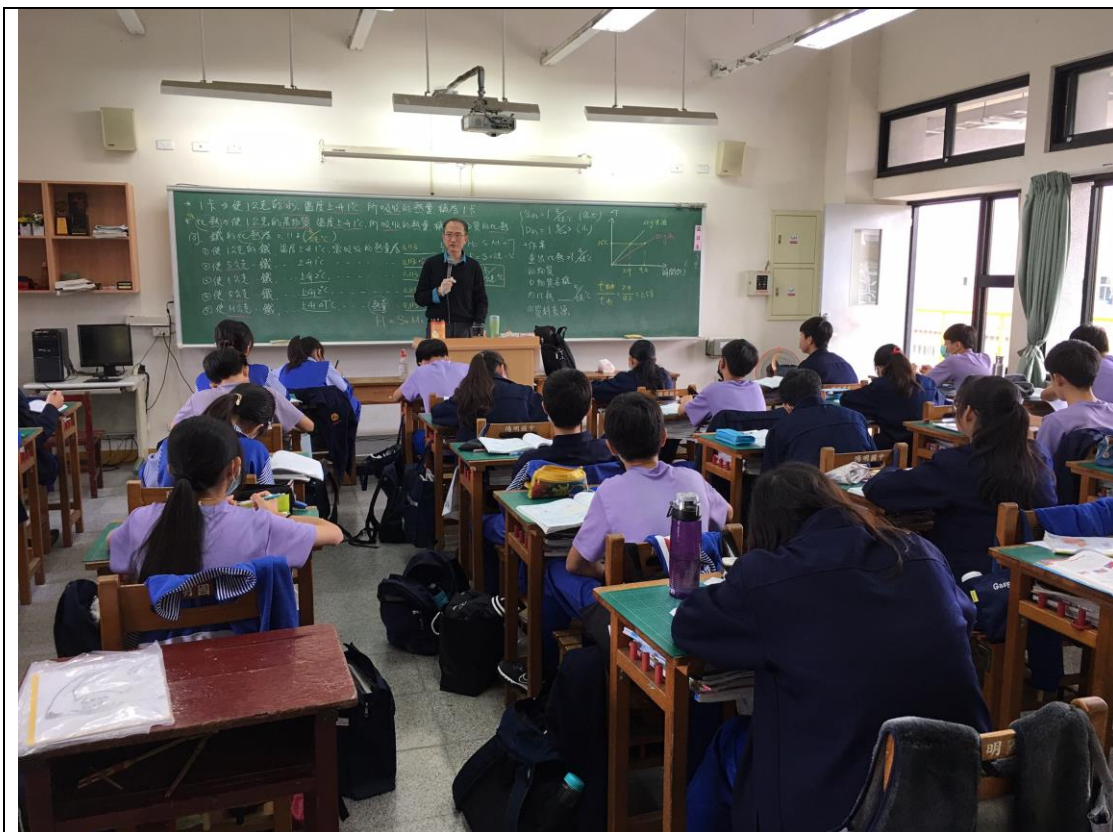
照片1說明：前半段課程，教師引導學生比熱的觀念