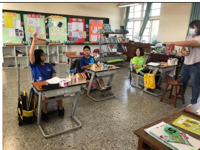
讓學生透過口述方式表達課文大意