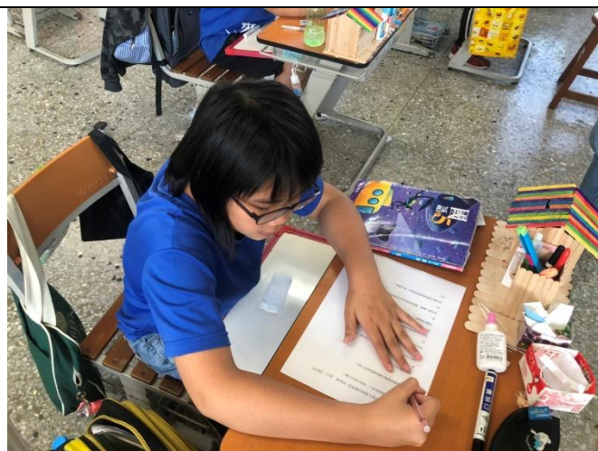
透過學習單讓學生更了解課文內容