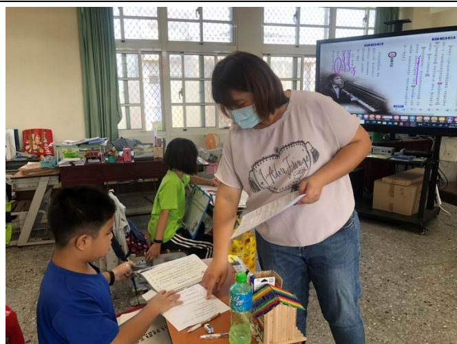
立即指導學生填寫學習單