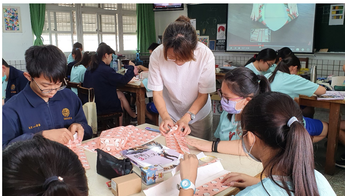
照片2說明：指導學生實際操作