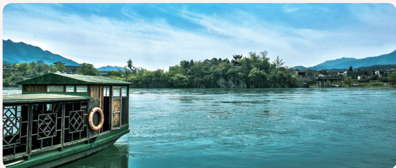
▲安徽省宣城市桃花潭風光

全詩用字遣詞質樸自然，頗有民歌的風味。古人寫詩，往往不在詩中直書姓名，然而此詩以自呼其名開始，又以對方之名作結，顯得親切率真，饒富人情味。