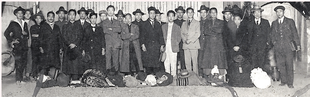
▲ 1923年12月16日賴和被捕入獄，次年1月出獄時留影。中間理光頭、穿大衣者為賴和。

賴和的作品具有強烈的時代性，他五十年的一生幾乎與日治時期重疊，因此創作中透露濃厚的反殖民意識，可作為臺灣歷經日治時期的見證，在臺灣現代文學史上有極重要的地位。