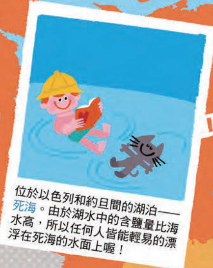
位於以色列和約旦間的湖泊——死海。由於湖水中的含鹽量比海水高，所以任何人皆能輕易的漂浮在死海的水面上喔！