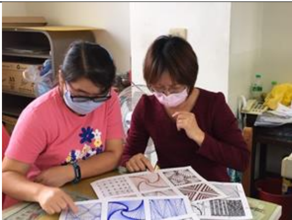
議課照片 1：學生作品分析