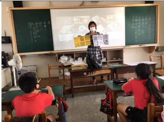
公開授課照片 1：解說纏繞畫的設計原則