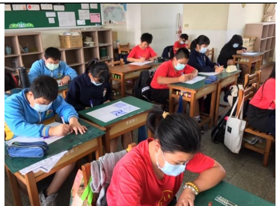
公開授課照片 3：學生實作情形