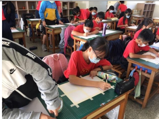
公開授課照片 2：規劃製作版面框架