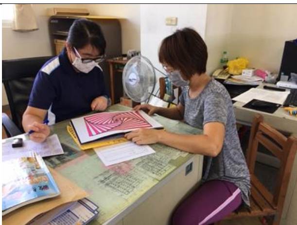
備課照片 1：教學設計來源