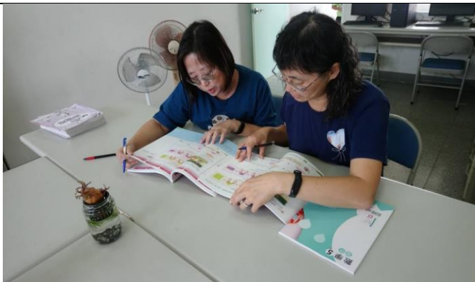
備課照片 1：說明教學科目及單元