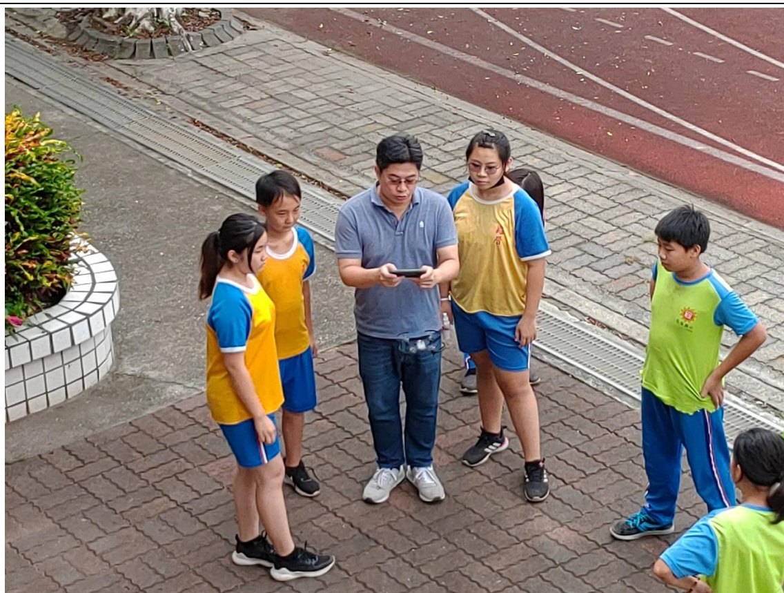
圖片說明：實際利用手機與無人機連線測試飛行。