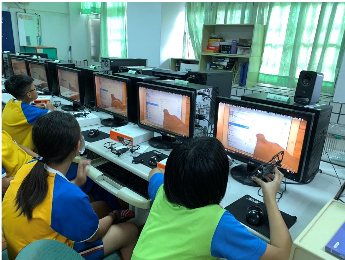
圖片說明：藉由影片的介紹，讓學生了解如何撰寫空拍機的程式。