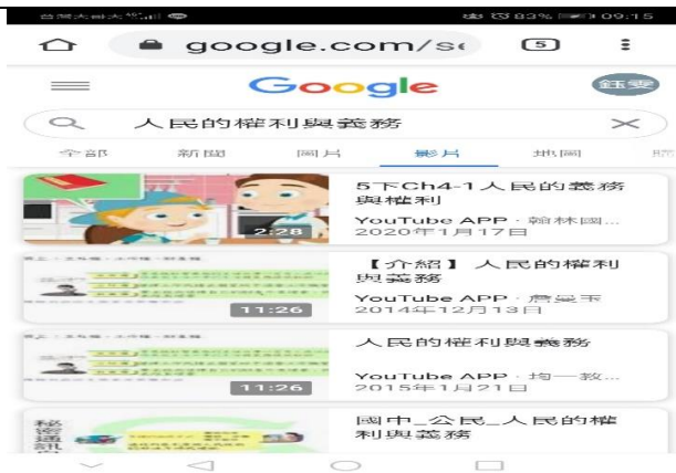
備課照片 1：參考網路資料