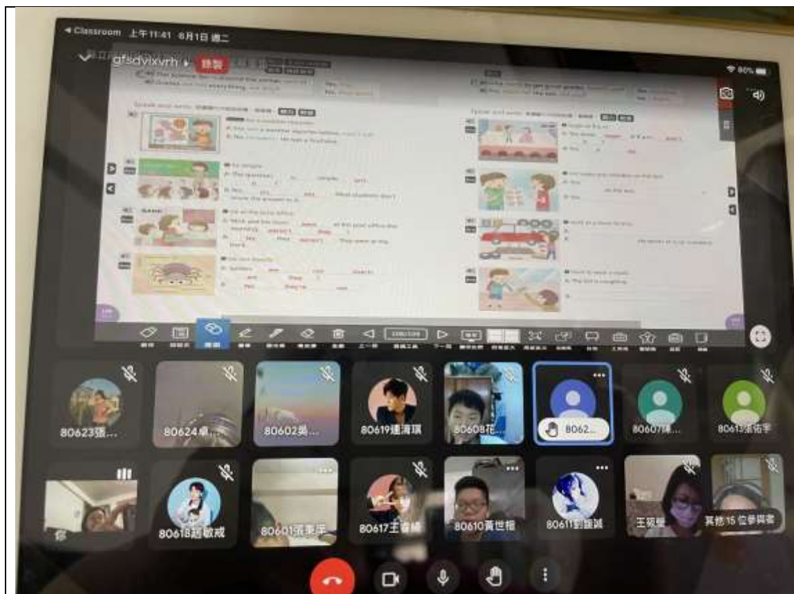
照片1說明：教師於線上教學時分享電子書頁面