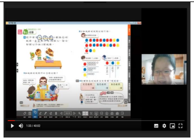
公開授課照片 2：學生輪流回答課本問題