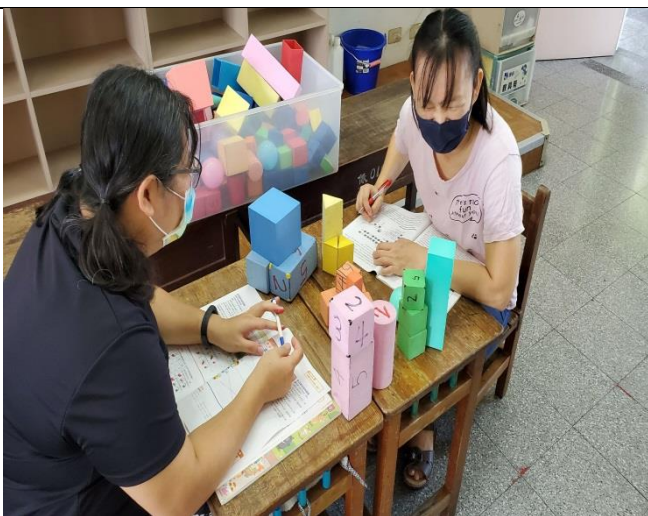
備課照片 1：說明教學科目及單元