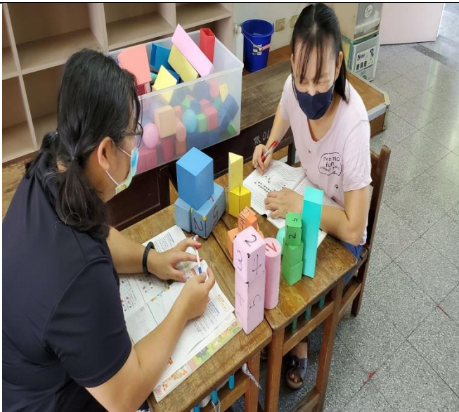
議課照片 1：利用顏色分類