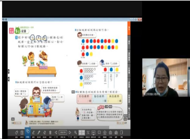
說課照片 1：分類記錄概念的說明