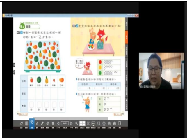
公開授課照片 1：習作講解