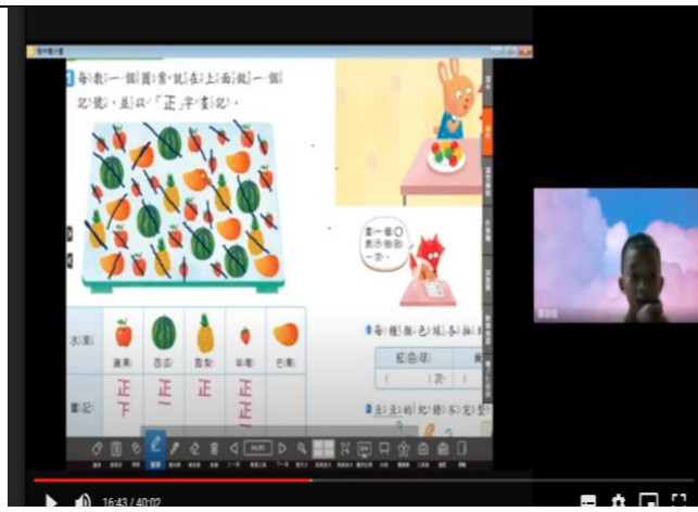
公開授課照片 3：學生輪流回答習作問題