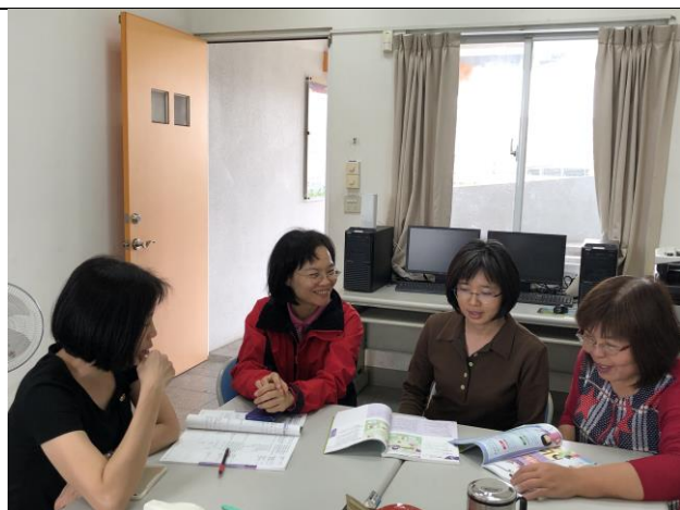
備課照片 1：觀課前討論