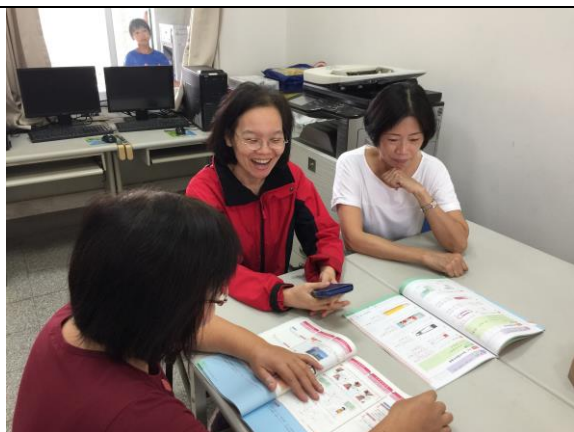
公開授課照片 1：學生發表分組拍照