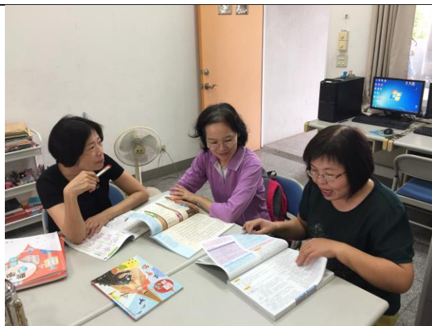
議課照片 1：觀課後議課