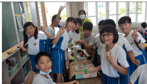
公開授課照片 4：學生發表分組拍照