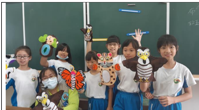
公開授課照片 3：學生發表分組拍照