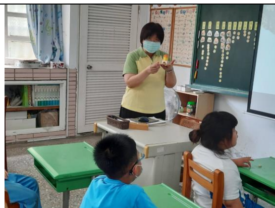
公開授課 2：積木操作說明