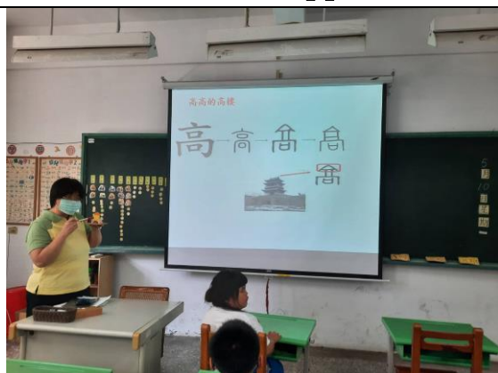
公開授課 1：ppt 教學