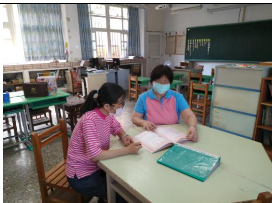
說課 1：說明上課內容