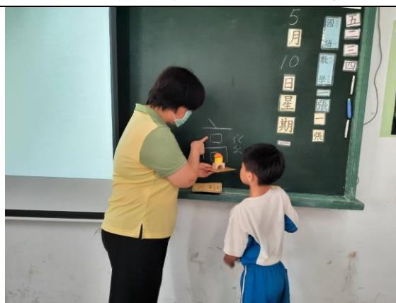
公開授課 3：個別指導