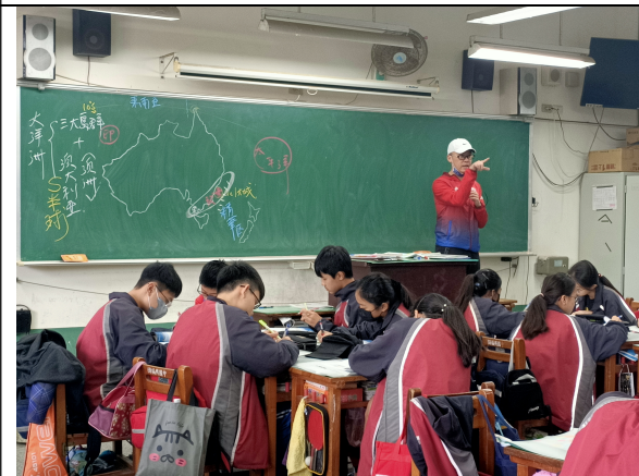
說明 舉例說明課程內容