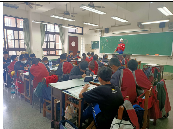
課程已講解的內容進行問與答