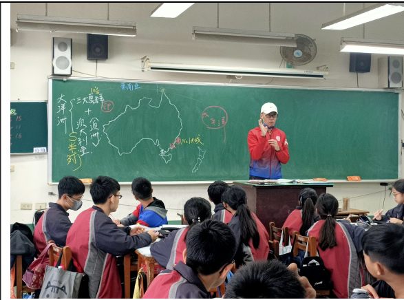
說明 說明教學預定目標