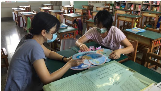
議課照片 1：學生作品分析