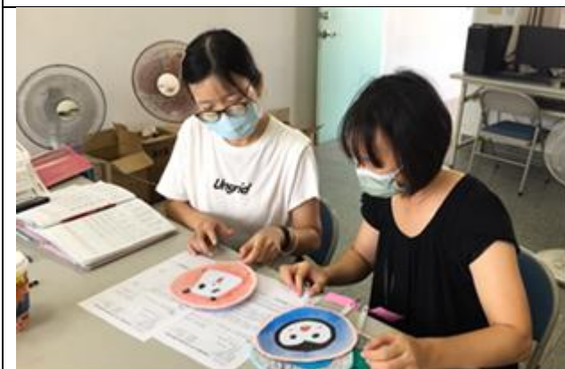
說課照片 1：實作設計檢討(上週學生作品)