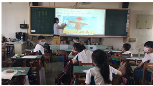
公開授課照片 2：規劃製作扇面圖案