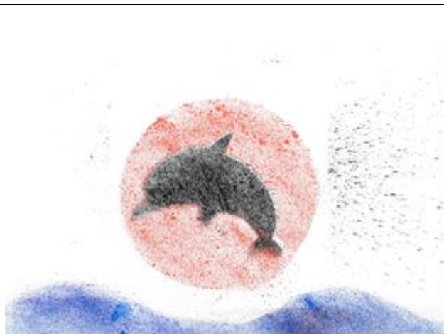
備課照片 1：教學設計來源(上屆學生作品)