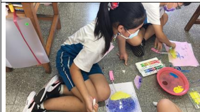
公開授課照片 3：學生實作情形