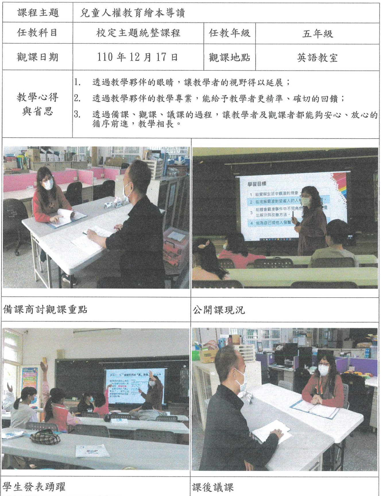
110 學年度彰化市國聖國小觀課議課成果表