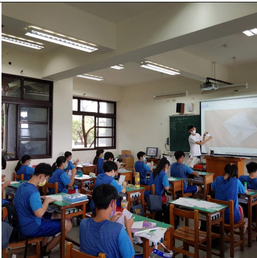
照片2 說明：實作部分，教師透過摺紙教學，製作有希臘柱式的紙屋。