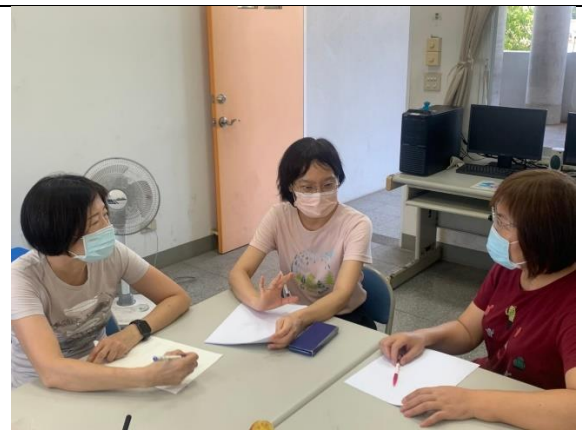
說課照片 2： 教案討論