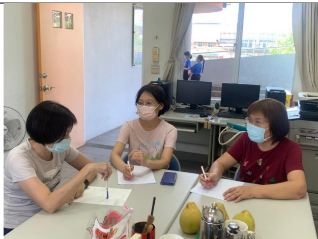
備課照片 1：公開授課者說明教學