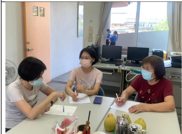
說課照片 1： 教案討論