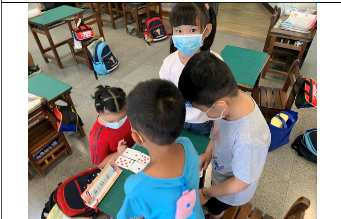
圖二、學生分組操作撲克牌練習10的分與合。