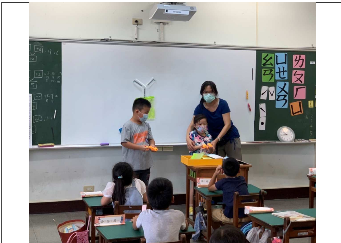
圖一、教師使用Y型管，複習「10以內的合」概念。