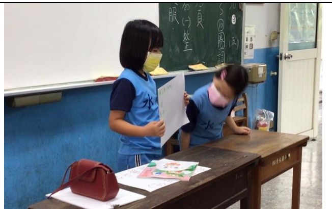
我來幫你大聲介紹，友情的展現