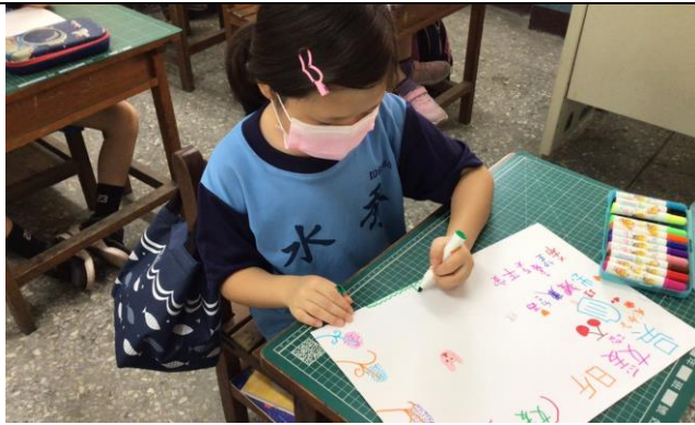
同學畫下自己的優點