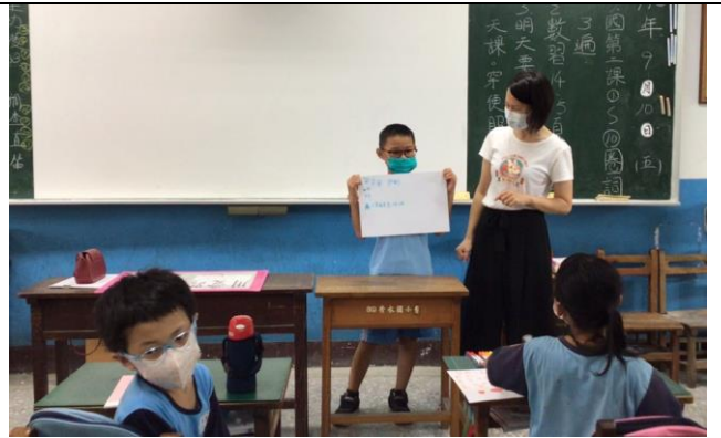
向同學展示自己的優點與自我介紹