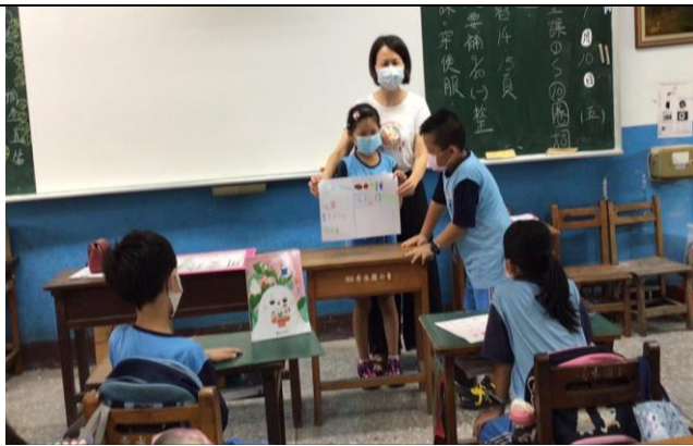
自我介紹，同學一起來幫忙