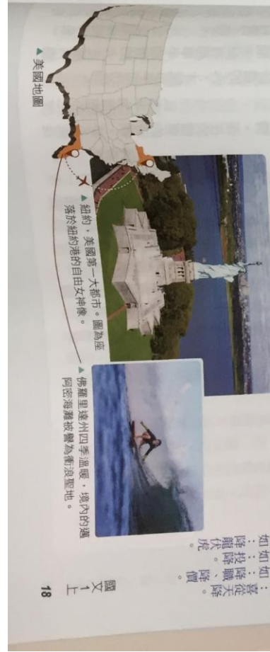
美國地圖 紐約，美國第一大都市。圖為亞 佛羅里達州四季溫暖，境內的邁 阿密海灘被譽為衝浪聖地。

【動】 無心500語彙 0531 【動】 無心500語彙 0531 【動】 無心500語彙 0531 【動】 無心500語彙 0531