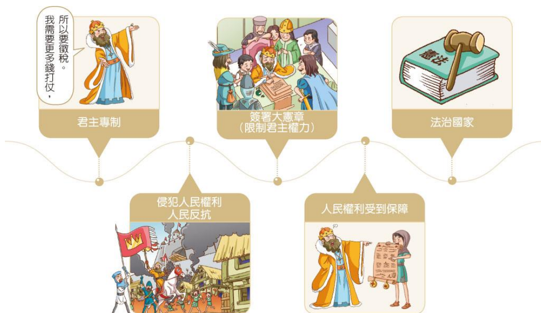
▲ 4-2-1 以英國為例的法治發展示意圖

在人治的社會，法律是統治者用來限制人民的工具，統治者不需遵守法律，法律規定也隨著統治者而改變。相反地，在法治社會中，法律最主要的功能是保障人民的權利，同時也約束政府及人民的行為。因此，在現代許多法治國家，都將立國精神與政府職權制定在憲法中，政府依據憲法治理國家，實踐憲政精神。