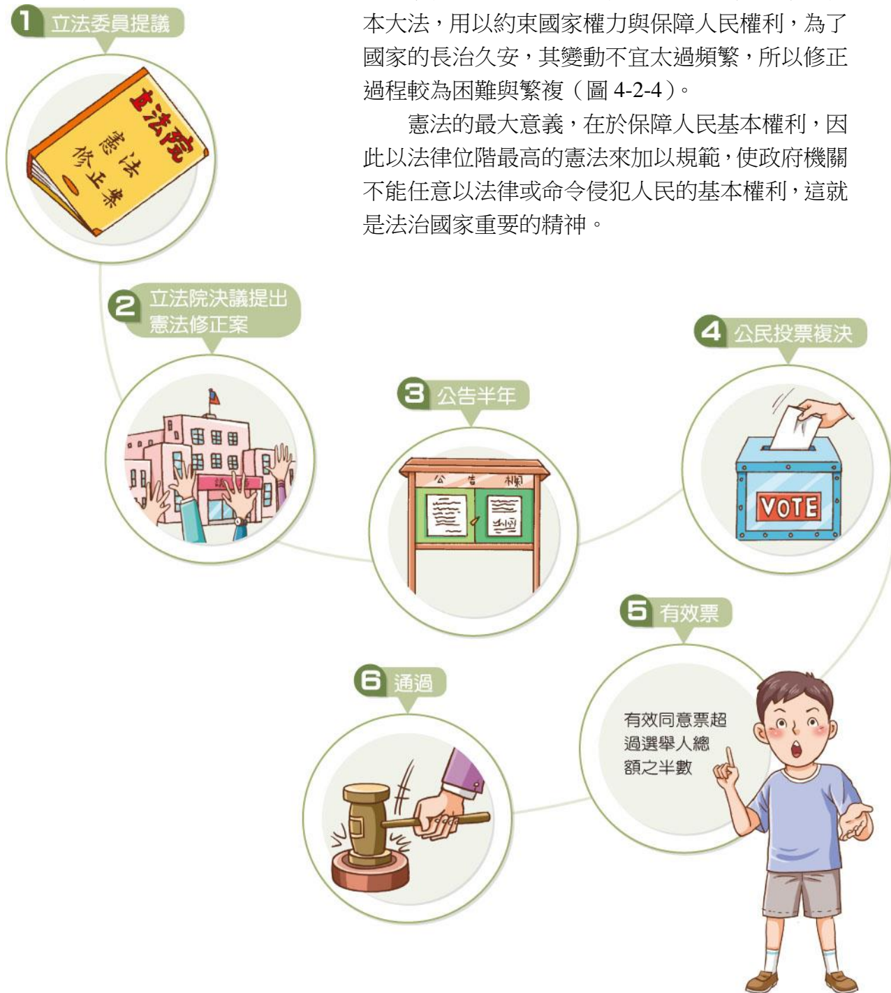
▲圖 4-2-4 我國憲法的修正程序示意圖

憲法的最大意義，在於保障人民基本權利，因此以法律位階最高的憲法來加以規範，使政府機關不能任意以法律或命令侵犯人民的基本權利，這就是法治國家重要的精神。