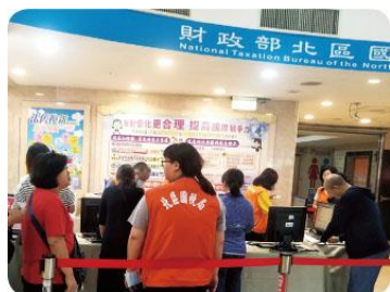
▲圖 4-2-2 徵稅／政府依據所得稅法規定，向人民課徵綜合所得稅，而人民須於每年 5 月如期繳納。