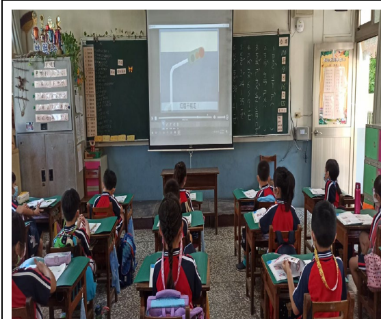
我們正在認真做題目哇！