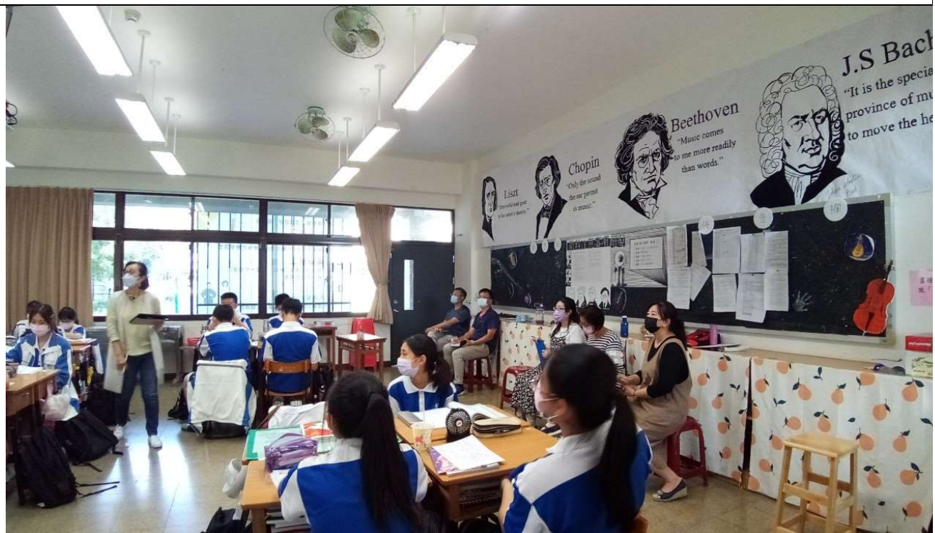
照片2說明：小組討論與提問