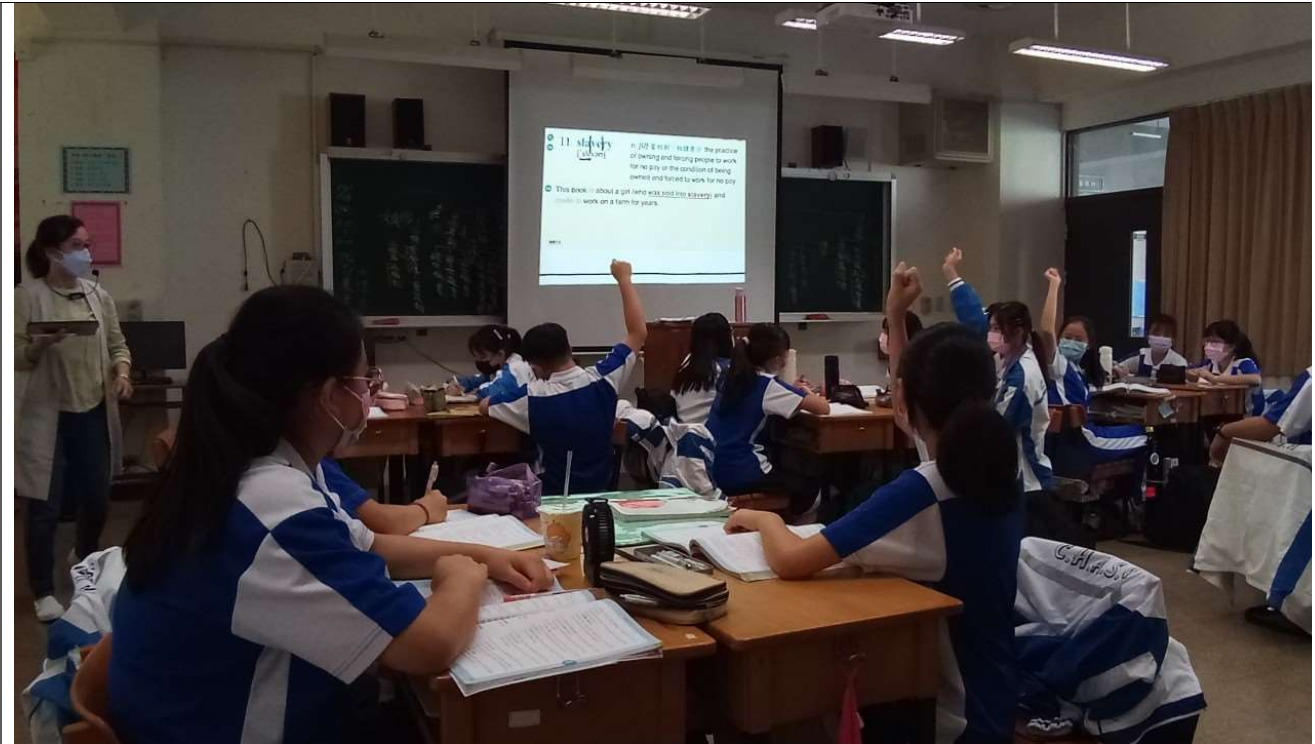
照片1說明：單字認讀與例句理解討論