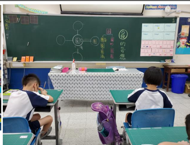
說明：不同句子裡面的「圓」有不同的意思