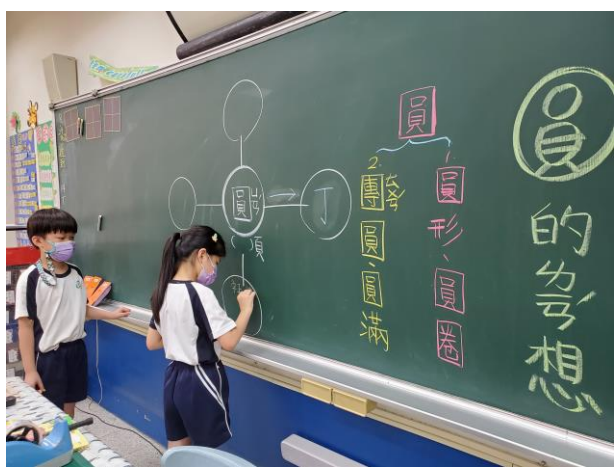
說明：學生上台與同學分享圓的語詞