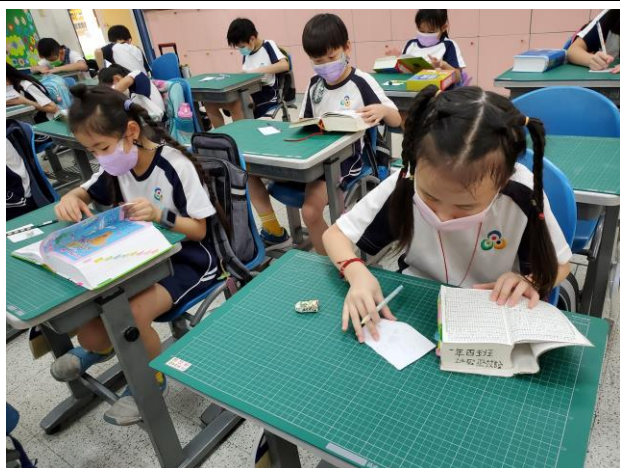
說明：學生查字典並記錄圓的語詞