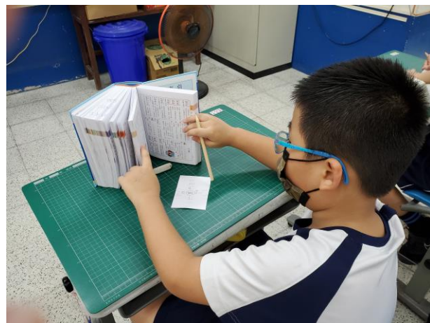
說明：學生運用字典查「圓」的語詞