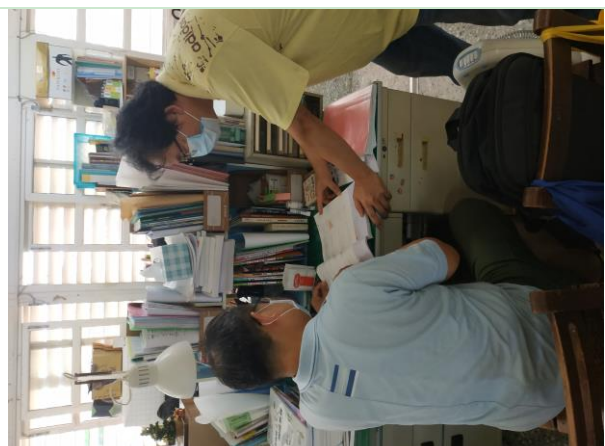
說明：9/14 議課 ~ 老師辦公室議課