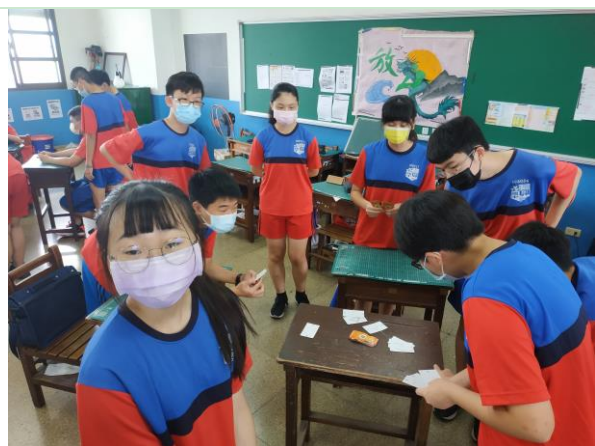
說明：9/13 觀課 ~ 學生互相討論