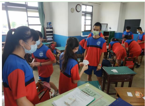
說明：9/13 觀課 ~ 學生活動進行中