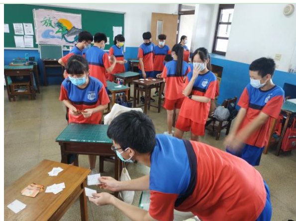
說明：9/13 觀課 ~ 學生入座 ~ 兼具防疫規定