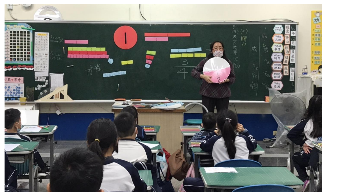
說明：透過具體的教具操作，建立學生對於圓形分數板的數感