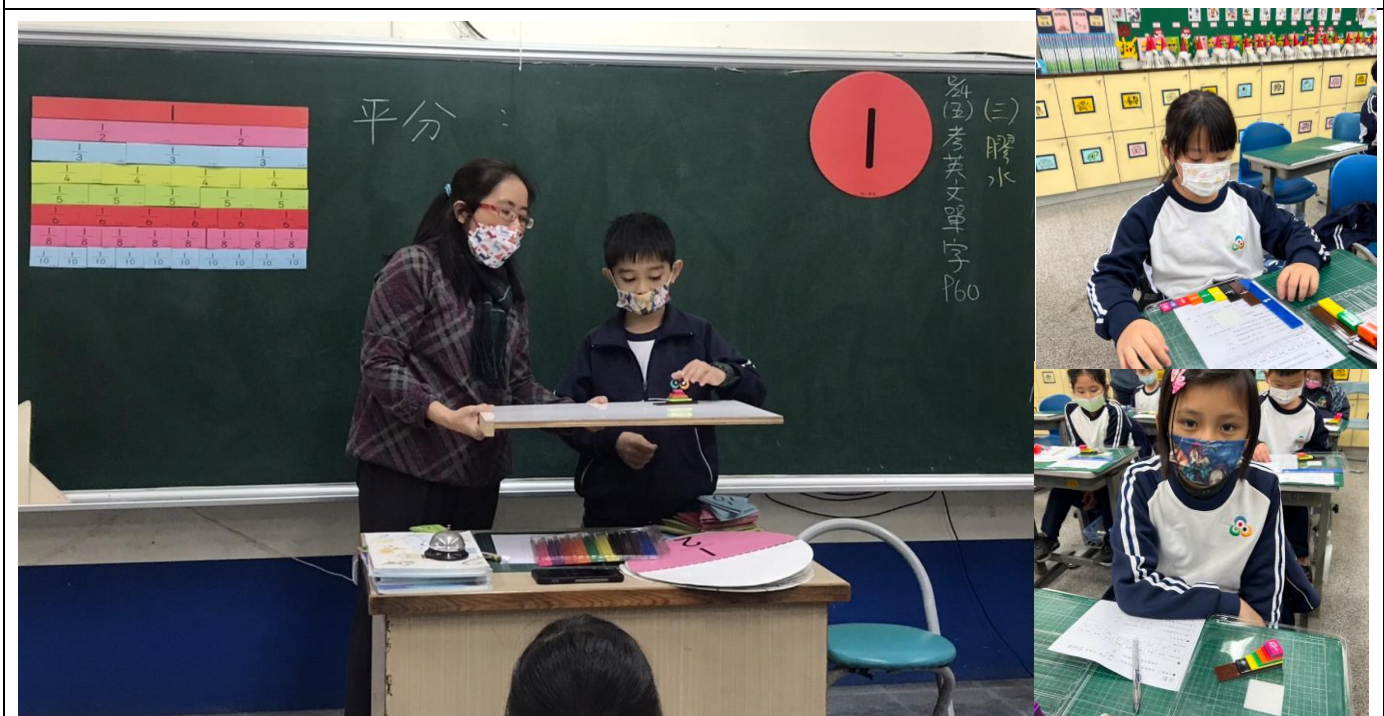
說明：讓學生各色拿出一片分數片進行比大小，請學生上臺說明他的比較方式和比較結果