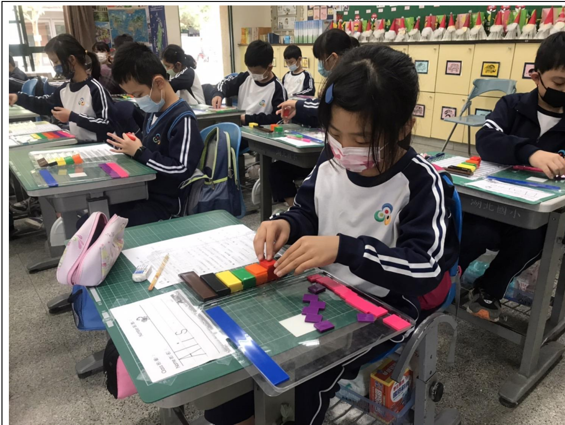
說明：請學生疊疊看，檢視分數牆中各種顏色的分數片是否都一樣大