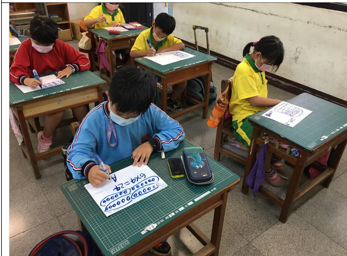
圖二、重新布題後，讓學生個別練習，教師巡視協助。