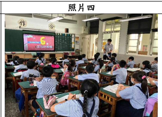
認識生命的開始和誕生