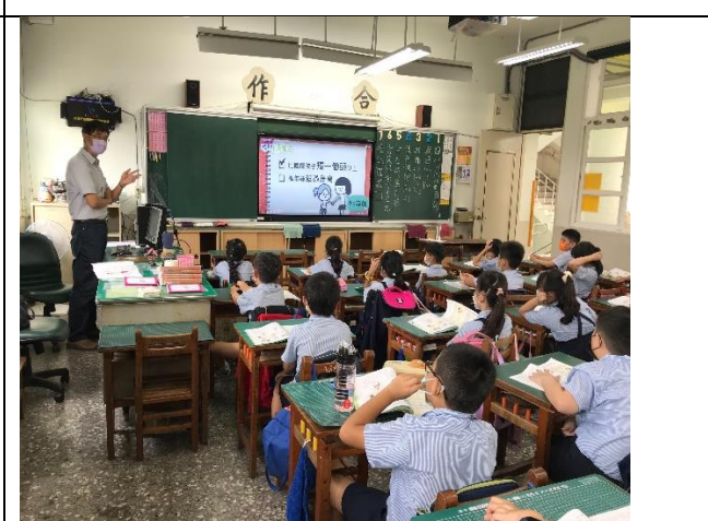
察身體的特徵是遺傳的結果